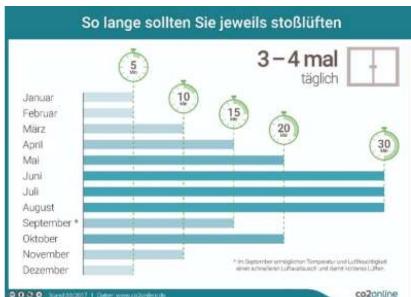
Abbildung 2: Ideale Stosslüftungsdauer nach Monat (co2online; 2020)

Beim Stosslüften hängt die vorgeschlagene Dauer von der Jahreszeit ab. In warmen Monaten sollte deutlich länger gelüftet werden wie in kurzen. Die folgende Abbildung zeigt einen Vorschlag der Lüftungsdauer für die verschiedenen Monate.