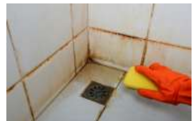
Abbildung 1: Roter Schimmel im 10. Wohnen; 2023

Neben dem schwarzen Schimmel gibt es tausende andere Schimmelararten und darunter auch den roten Schimmel. Dieser befindet sich häufig in Badezimmern und Küchen. In Abbildung 1 ist gezeigt, wie roter Schimmel aussehen kann und auf der unten verlinkten Webseite von Gesund Wohnen können Tipps zum Entfernen von rotem Schimmel gefunden werden.